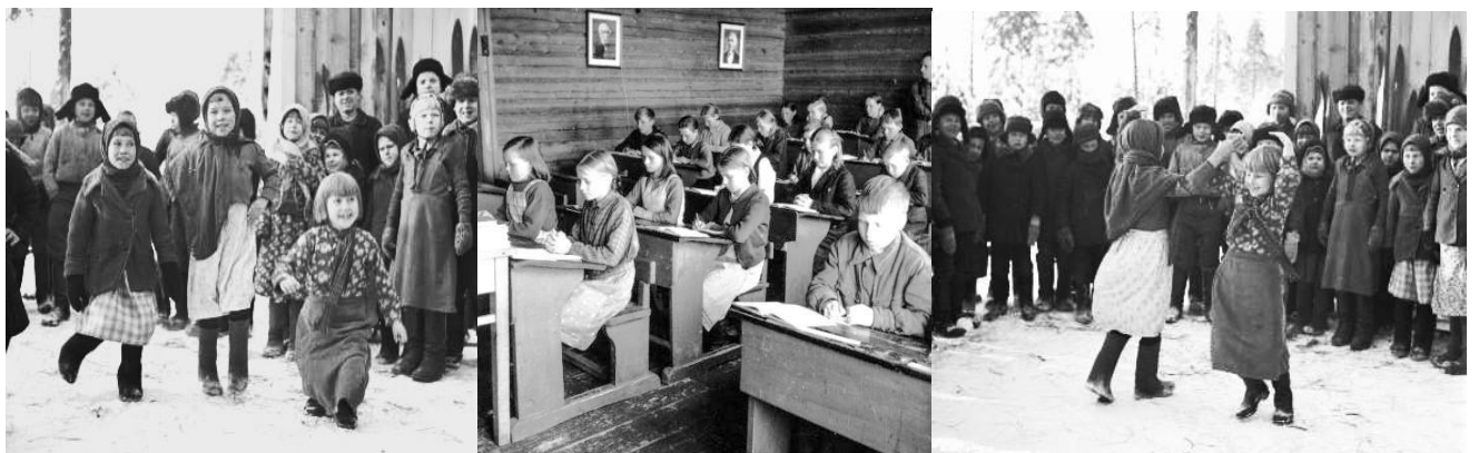
Vasemmalla: Tytöt tanssivat kansantanssia kansakoulun välitunnilla (Nurmoila 3.2.1942). Keskellä: Kansakoululaisia luokassa. Seinällä Snellmanin ja Lönnrotin kuvat (Aunus 1942). Oikealla: Kaksi tyttöä tanssivat kansantanssia kansakoulun välitunnilla (Nurmoila 23.2.1942).

Vitelissä oli jatkosodan aikaan Suomen Punaisen Ristin sairaala ja lastensairaala. Vitelissä oli 800 poliittista vankia.