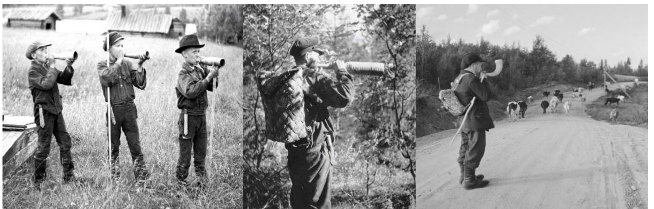
Kuvat: vasemmalla oleva kuva (Auvo Hirsijärvi, Museovirasto), keskikuva (Eino Mäkinen, Museovirasto), oikealla oleva kuva /Borg, SA-kuvat).

Oikealla: Pojilla on huvia potkupallosta. (Soutjärvi, Metsäntaka 24.6.1943).