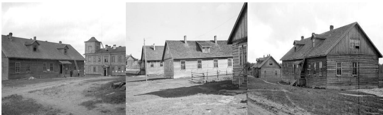
Vasemmalla ja oikealla olevat kuvat (Borg), keskikuva (Olavi Aavikko). SA-kuvat.

https://www.sotahistoriallisetkohteet.fi/app/sights/view/-/id/1293