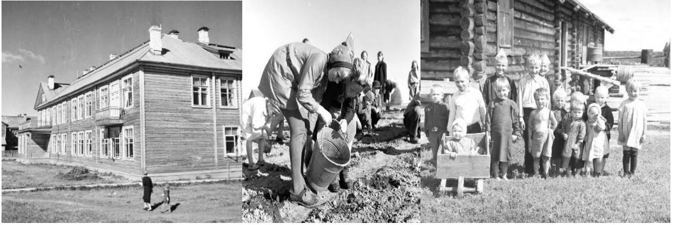
Vasemmalla: Aunuksen kansakoulu (27.8.1943). Keskellä: Mukava ulkosalla oppia, Aunuksen kansakoulun kerhotoiminta (9.6.1942). Oikealla: Nousevaa polvea ja tulevia koululaisia (Aunus, Vitele 15.9.1942).