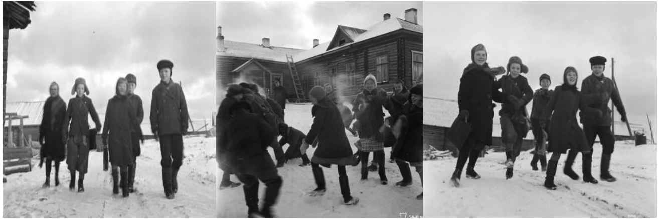
Vasemmalla: Aunuksen lapsia reippailemassa koulutiellä (Vitele 24.11.1942). Keskellä: Aunuksen koululaisia pihaleikissä koulun pihalla (Vitele 24.11.1942). Oikealla: Iloisia lapsia koulutiellä (Vitele 24.11.1942).

Vitelissä oli jatkosodan aikaan Suomen Punaisen Ristin sairaala ja lastensairaala. Vitelissä oli 800 poliittista vankia.