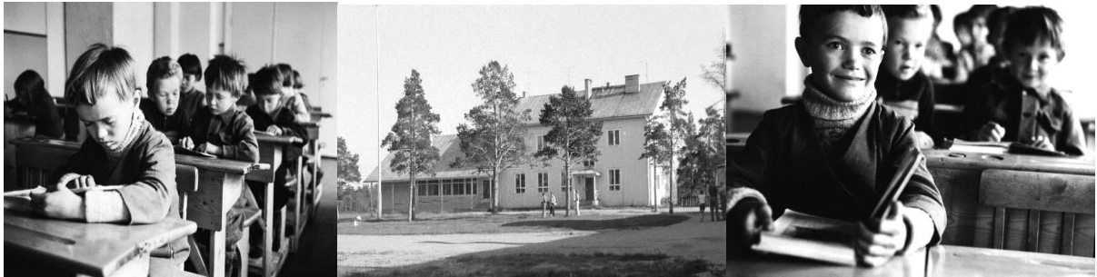
Vasemmalla: Sevettijärven koulu 1952 Oppilaita lukemassa. Koulukirjojen kieli oli suomi.