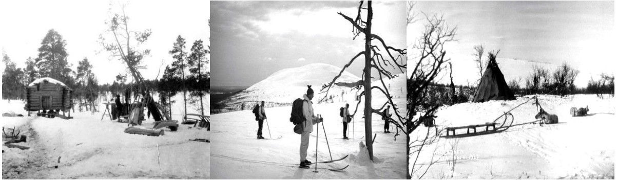
Vasemmalla: Petsamo 1926, Suonikylä Akkujärvi Patsas-aitta nili, ulku ja saneja.