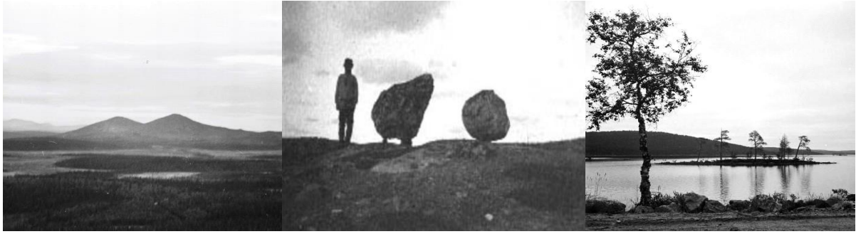
Vasemmalla: Sodankylän Nattastunturit sijaitsevat vuonna 1956 perustetun Sompion luonnonpuiston alueella.