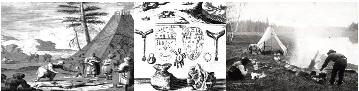
Vasemmalla: Henkien manaus noitarummun avulla.