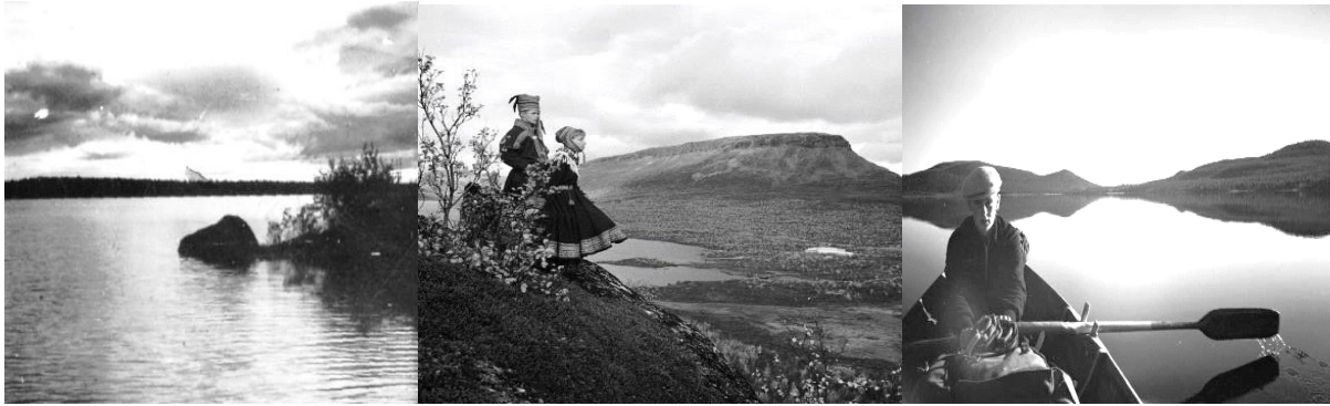
Vasemmalla: Inari 1932. Seitakivi rannassa.