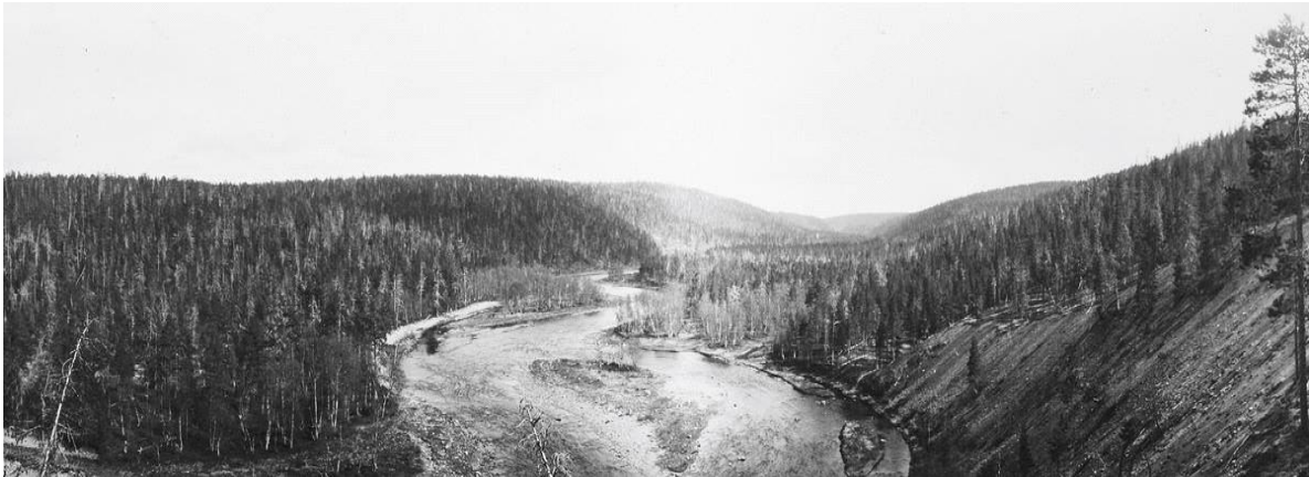
Inari 1929. Näkymä Tolosjoelle 1929.