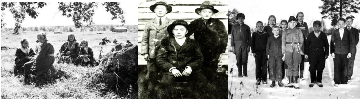
Vasemmalla: Inarin vanhalla kirkolla rippikoululaisia niityllä 14.7.1946.