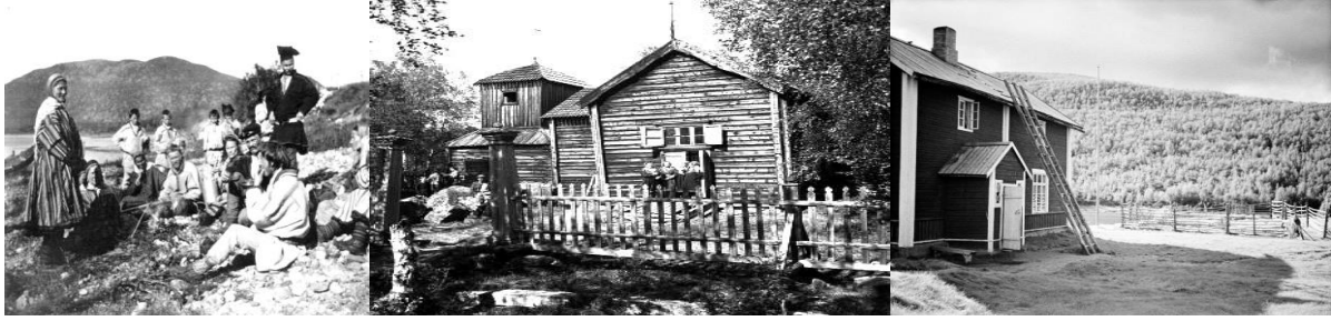
Vasemmalla: Kirkkoväkeä Outakosken kansakoulun pihalla 1918.