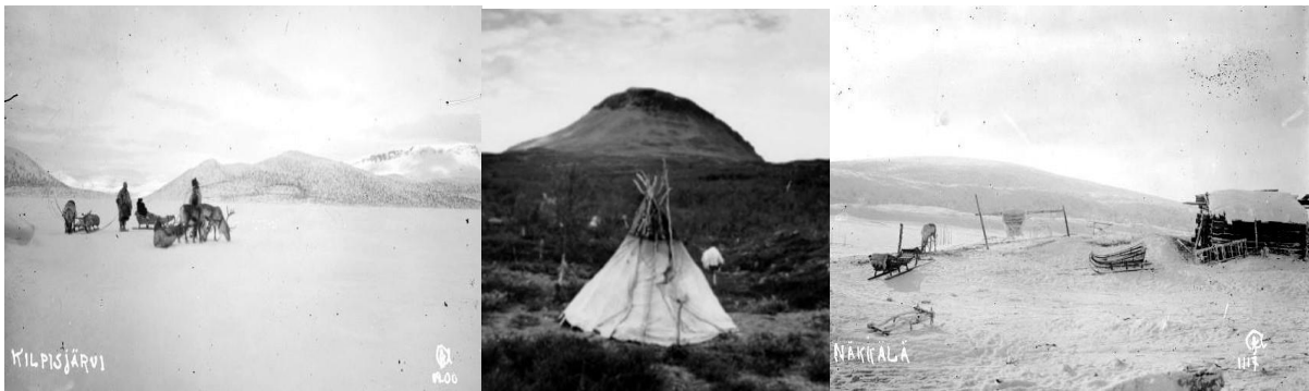
Vasemmalla: Kilpisjärvi 1920-luvulla matkailijat poron vetämässä reessä.