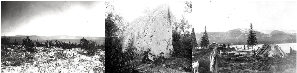
Vasemmalla: Sodankylä 1927. Saariselkä Varpupäältä nähtynä.