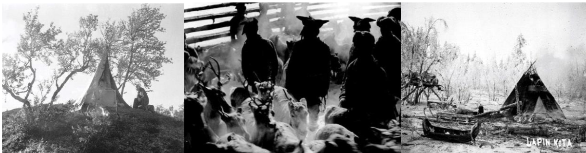
Vasemmalla: Inarissa Telttailua Kaunispäällä 1953.