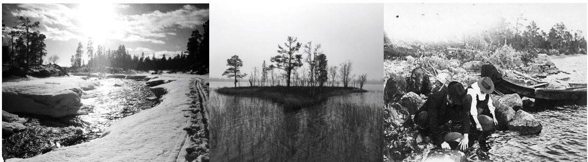
Vasemmalla: Inari Juutuanjoki talviasussaan ja Jäniskoski virtaa kevättä kohti 1938.