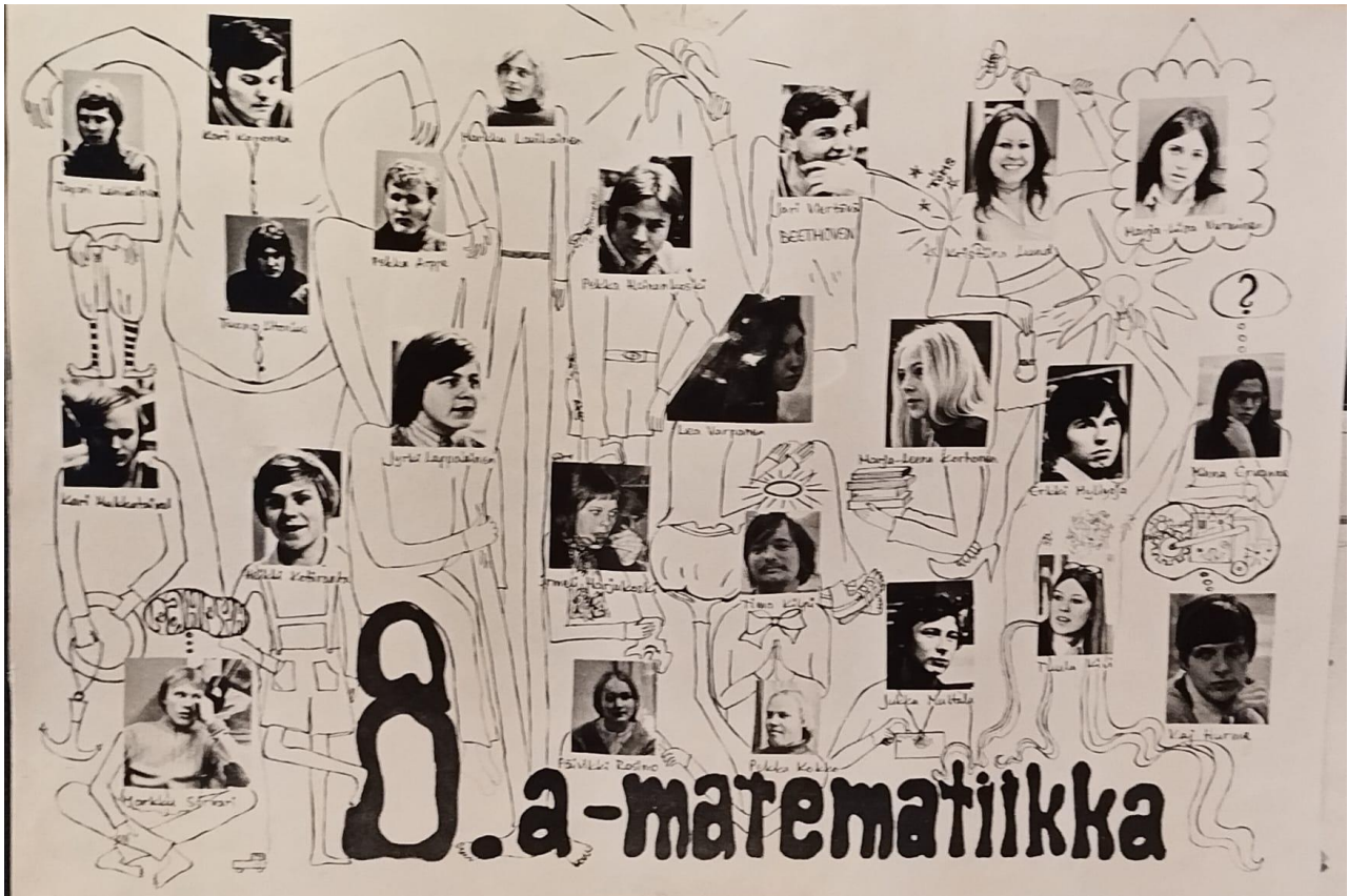
Kuva 10: Tein meille erilaisen luokkakuvan abivuoden syksyllä 1970, kirjoitukset oli 1971.