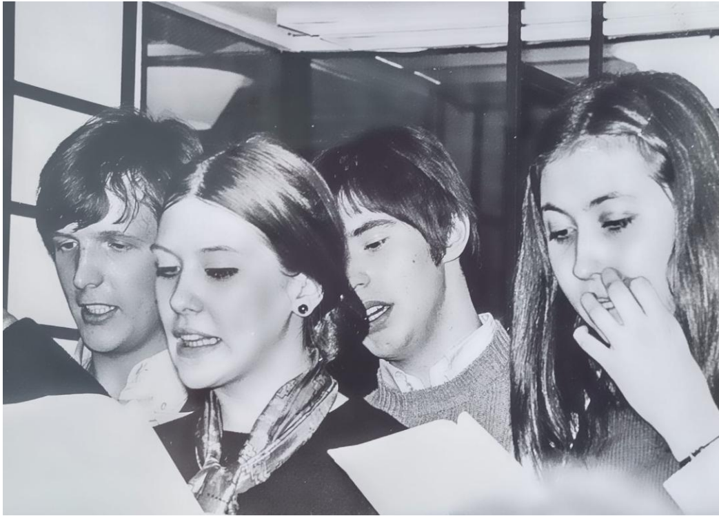
Kuva 9: Abeista tehtyt laulut esitettiin penkkareissa helmikuussa 1970. LV kuvassa oikealla.