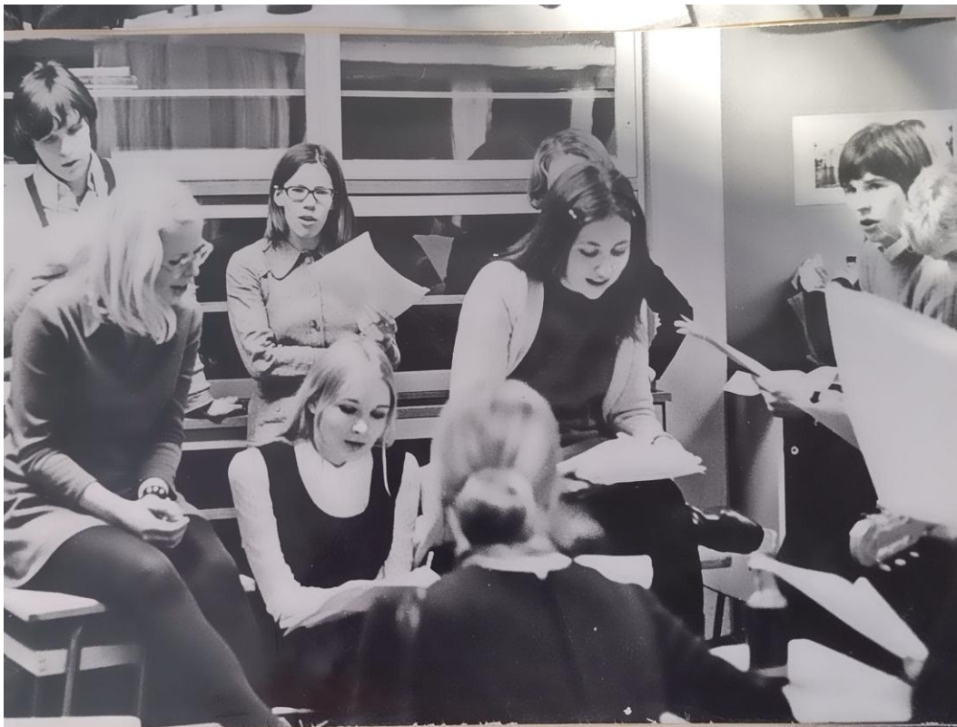
Kuva 8: Lukion toisella syksystä 1969 helmikuuhun 1970 tehtiin abeista lauluja, joita tässä harjoitellaan.