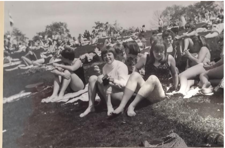
Kuva 2: Pohjoismaiden pääkaupunkien kisat Oslossa kesäkuussa 1966, vapaa-aikana päästiin uimaan. Kuvassa korisjoukkueen lisäksi tyttöjen yleisurheilijoita, poikien jalkisjoukkue ja yleisurheilijat jossain muualla.